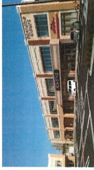
イオンスタイル上所店まで449m(徒歩9分)