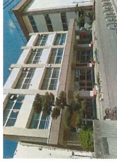
新潟市上所小学校まで1044m(徒歩14分)