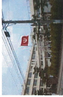
新潟市立鳥屋野中学校まで1411m(徒歩18分)