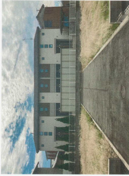
現地土地写真 豊栄駅徒歩圏内です。