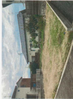
現地土地写真 No.2の現地外観。