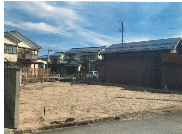
前面道路含む現地写真 現地(2022年3月)撮影