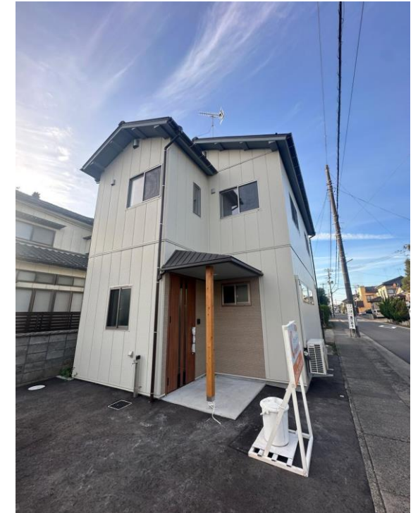
現地外観写真 南東角地で日当たりが良いです♪